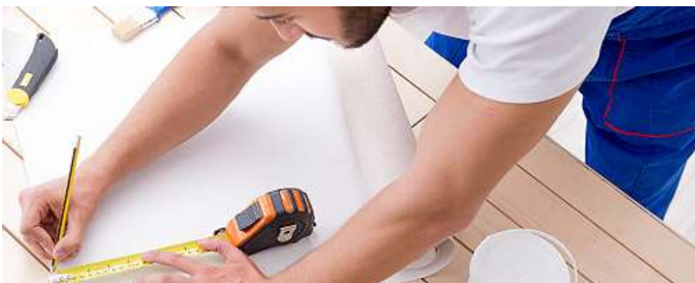
Строительные работы и ремонт помещений

Налог на профессиональный доход можно платить и при осуществлении других видов деятельности, если соблюдаются все условия, предусмотренные Федеральным законом от 27.11.2018 № 422-ФЗ.