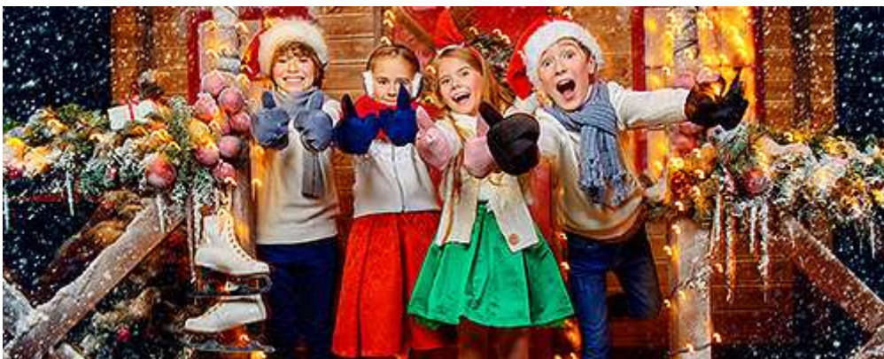
Проведение мероприятий и праздников