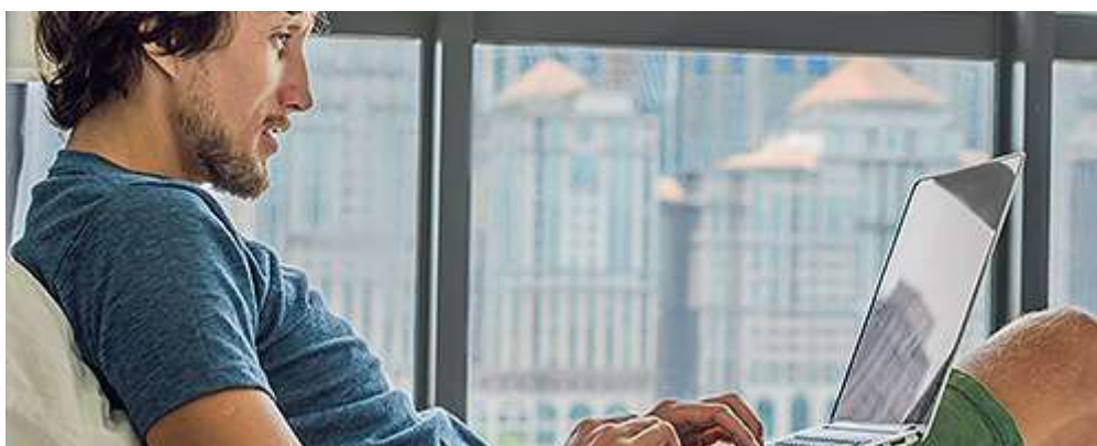
Удаленная работа через электронные площадки

Вот несколько примеров, когда налогоплательщикам (самозанятым) подойдет специальный налоговый режим.