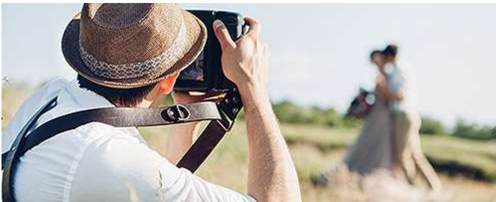
Фото- и видеосъемка на заказ