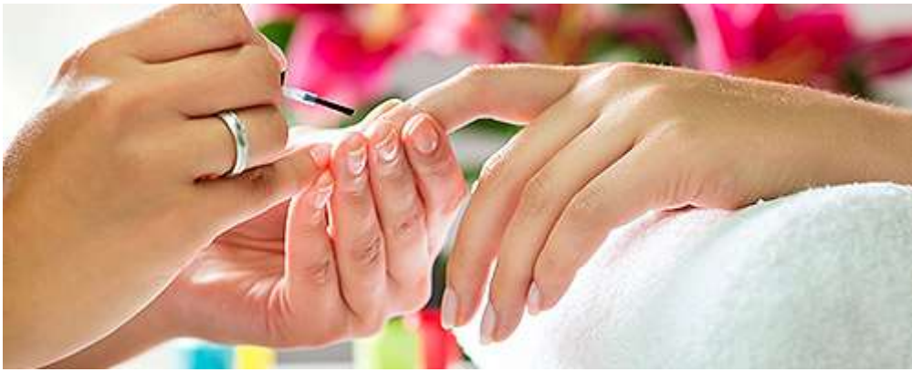
Оказание косметических услуг на дому