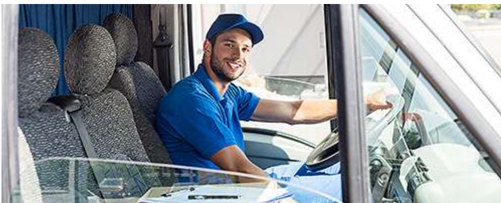
Услуги по перевозке пассажиров и грузов