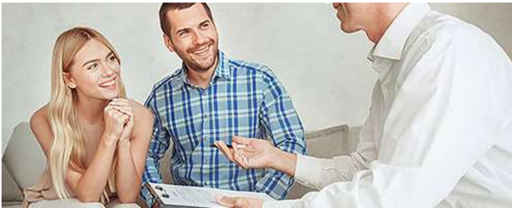
Сдача квартиры в аренду посуточно или на долгий срок