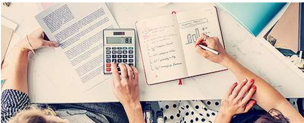
Юридические консультации и ведение бухгалтерии