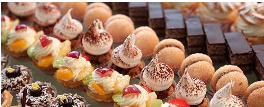
Продажа продукции собственного производства